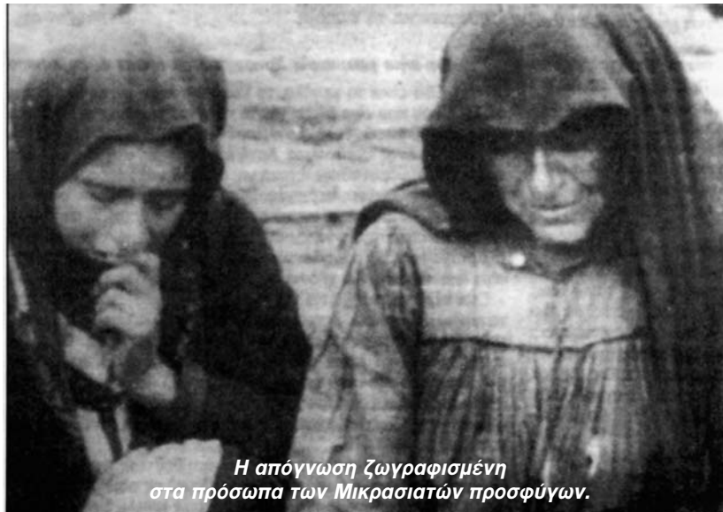
Η απόγνωση ζωγραφισμένη στα πρόσωπα των Μικρασιατών προσφύγων.

Μετά την αποχώρηση του Ελληνικού Στρατού από τη Μικρά Ασία η κατάσταση δεν ευνοούσε συνέχιση του αντάρτικου. Με τις μαζικές εκτελέσεις και τις λευκές πορείες θανάτου ουσιαστικά ελληνικός πληθυσμός δεν υπήρχε πλέον στον Πόντο. Για όσους είχαν επιζήσει, είχε ήδη αποφασιστεί η απομάκρυνσή τους, αφού είχε υπογραφεί η ελληνοτουρκική συμφωνία για ανταλλαγή πληθυσμών. Πρέπει να σημειωθεί ότι πολλοί καπετάνιοι, στο άκουσμα της συμφωνίας εκείνης αντέδρασαν με σφοδρότητα. Ο Πόντος ήταν η πατρίδα τους για 30 και πλέον αιώνες και δεν συζητούσαν καν μετάβασή τους στη μητροπολιτική Ελλάδα. Παρά την ήττα του Ελληνικού Στρατού και την εκκένωση της Μικράς Ασίας, πολλοί οπλαρχηγοί δήλωσαν αποφασισμένοι να συνεχίσουν τον ένο-