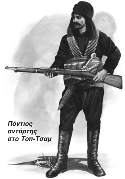
Πόντιος αντάρτης στο Τοπ-Τσαμ

Ο ποντιακός ελληνισμός δεν δέχθηκε μοιρολατρικά τον αφανισμό του. Χιλιάδες άνδρες κατέφυγαν στα βουνά, δημιούργησαν ένοπλα αντάρτικα σώματα και πολέμησαν τον κεμαλικό στρατό και τους Τούρκους ατάκτους . Στον αγώνα αυτό οι αντάρτες πολέμησαν με θάρρος έχοντας όλες τις παραμέτρους εναντίον τους την απόσταση από την Ελλάδα, αλλά και την απουσία βοήθειας από τον Ελληνικό Στρατό που μάχονταν