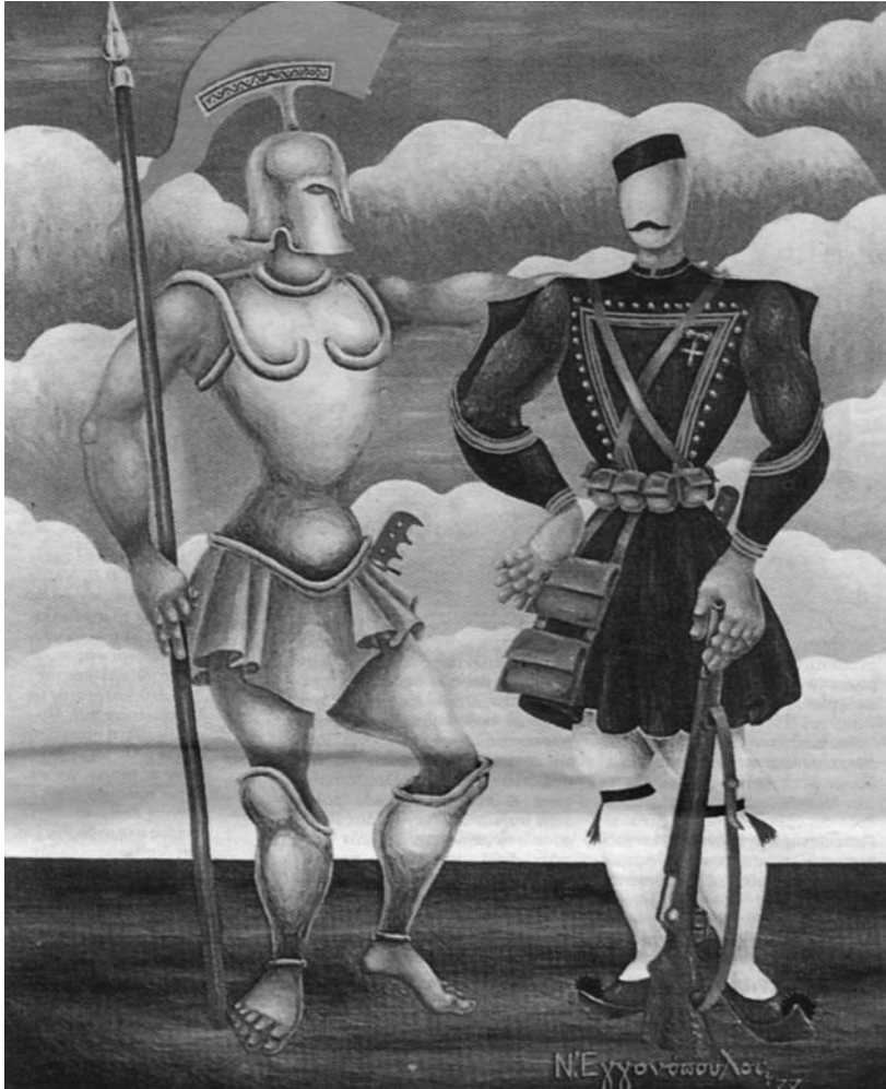
Ο Π. Μελάς αδελφωμένος με τον Μ. Αλέξανδρο ποζάρει δίπλα του σαν αγαπητός φίλος ή, σωστότερα σαν αδελφός εν όπλοις για φωτογράφιση. Τους συνδέουν όχι μόνο η Μακεδονία και η μετά θάνατον δόξα, αλλά και το νεαρό της ηλικίας. Ατυχοί, το μοιραίο τους βρήκε πάνω στην ακμή και ακριβώς στην ίδια ηλικία.

υποκίνηση εξεγέρσεων. Οι παροικίες προσφύγων από τη Μακεδονία και τις άλλες βόρειες επαρχίες πίεζαν τις ελληνικές Κυβερνήσεις να τους συνδράμουν. Συναντούσαν όμως ελάχιστους αποδέκτες στο αίτημά τους. Με εξαίρεση ορισμένους διαπρεπείς εκπαιδευτικούς και λιγό-