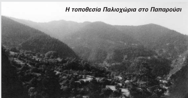
Η τοποθεσία Παλιοχώρια στο Παπαρούσι