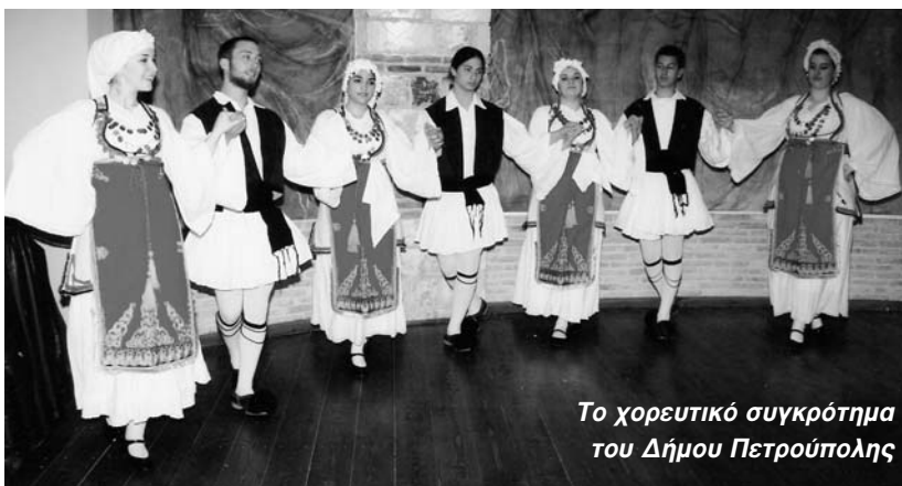
Το χορευτικό συγκρότημα του Δήμου Πετρούπολης