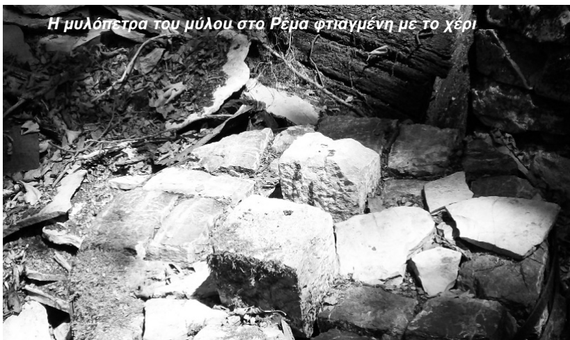
Η μυλόπετρα του μύλου στο Ρέμα φτιαγμένη με το χέρι