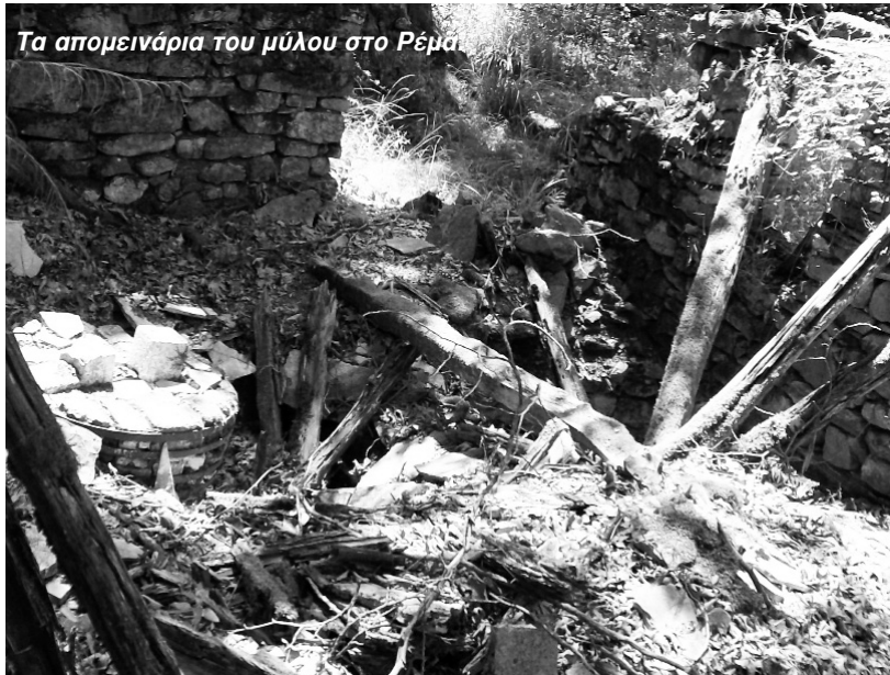
Τα απομεινάρια του μύλου στο Ρέμα

ομαλή ροή του νερού. Στο σημείο που η κοίτη του ρέματος απείχει 5 με 10 ή 15 μέτρα από το αυλάκι και είχε την κατάλληλη υδραυλική πτώση «κρέμαση» χτιζόταν το παραδοσια-