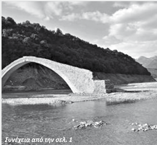
Συνέχεια από την σελ. 1