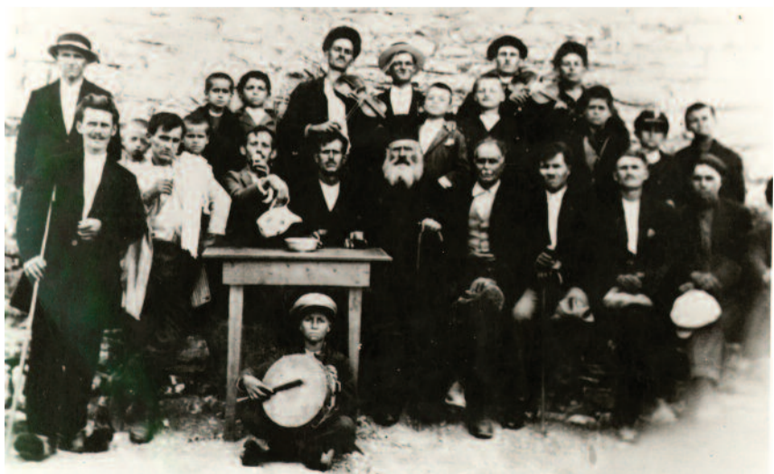
Φωτογραφίες από τις αρχές του 20ού αιώνα. Διακρίνονται τσαρούχια και φουστάνελες.