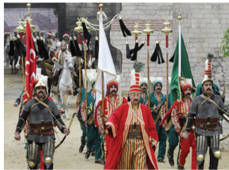
Θλιβερή εικόνα αναπαράστασης της Άλωσης της Πόλης από τους Τούρκους

Από την ίδρυση του Ελληνικού Κράτους (συμβατικά το 1830) οι εκδυτικισμένοι ευρωπαϊστές και γι' αυτό στα Εκκλησιαστικά Ενωτικοί, και, σύμφωνα με τα σημερινά δεδομένα εκσυγχρονιστές (δηλαδή νεωτεριστές και μετανεωτεριστές), φαίνεται ότι έχουν στις αντορθόδοξες πρακτικές τους την «αλλαγή» του Έθνους ως διαστροφή και καταστροφή της ταυτότητάς του. Ήδη οι οπαδοί της Βαυαροκρατίας έβαλαν στο στόχαστρό τους τα Μοναστήρια και τους Μοναχούς. Διότι οι Ευρωπαίοι και ευρωπαϊστές γνωρίζουν καλά, ότι ο χώρος αυτός εξασφαλίζει την συνέχεια της ελληνορθόδοξης παράδοσης και της συνοχής του Έθνους μας. Το πνεύμα του εξευρωπαϊσμού παραμένει έκτοτε συνδεδεμένο