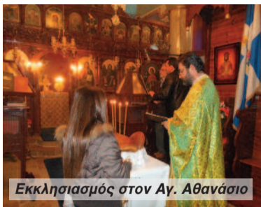
Εκκλησιασμός στον Αγ. Αθανάσιο

Η οικογένεια Κοτρώτσιου με πειροσσή προθυμία προσέφερε τους άρτους και τα κεράσματα για την εορταστική Θεία Λειτουργία.