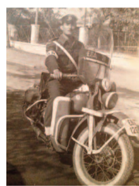
Στρατονόμος στην Στρατιωτική Αεροπορία