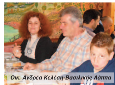
Οικ. Ανδρέα Κελέση-Βασιλικής Λάππα