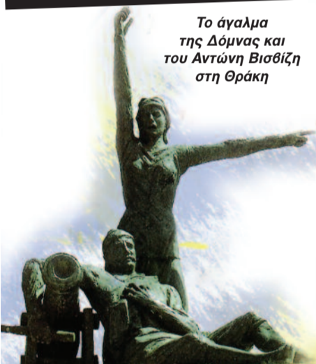
Το άγαλμα της Δόμνας και του Αντώνη Βισβίτη στη Θράκη

Γεννήθηκε το 1784 από εύπορη οικογένεια στην Αίνο της Ανατολικής Θράκης αξιόλογη ναυτική πολιτεία, γνωστή από τα χρόνια του Ομήρου, που εξελίχθηκε στο πέρασμα των αιώνων και αναπτύχθηκε καθώς οι κάτοικοί της διακρίθηκαν για το γνήσιο ελληνικό τους φρόνημα.