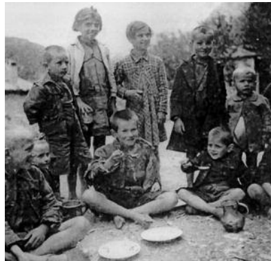
Παιδιά του χωριού την ώρα του συσσιτίου