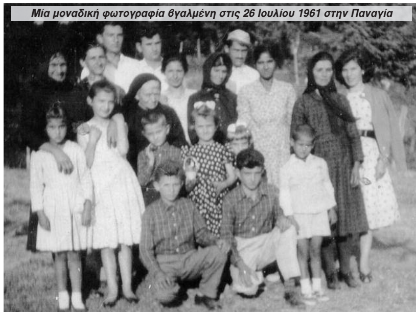
Μία μοναδική φωτογραφία βγαλμένη στις 26 Ιουλίου 1961 στην Παναγία

Στις 24 Μαρτίου 1952, γεννήθηκε η Φρειδερίκη, "Φρείντα" .