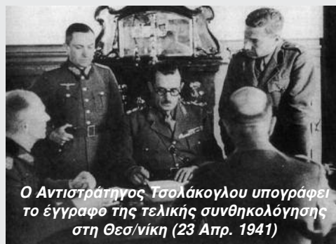
Ο Αντιστράτηγος Τσολάκογλου υπογράφει το έγγραφο της τελικής συνθηκολόγησης στη Θεσ/νίκη (23 Απρ. 1941)

καμία περίπτωση δεν δέχονταν την υποταγή σε μία δύναμη κατοχής την οποία είχαν νικήσει στα βουνά της Β. Ηπείρου και της Αλβανίας. Ο Τσολάκογλου παρουσίαζε το εαυτό του ως υποστηρικτή μιας «έντιμης παράδοσης» μπροστά στην ανωτερότητα της γερμανικής στρατιωτικής δύναμης. Διαψεύσθηκε όμως από τις εξελίξεις καθώς οι Γερμανοί δεν φάνηκαν διατεθειμένοι να διαταράξουν τις σχέσεις τους με τους συμμάχους τους. Γι' αυτό άλλωστε έθεσαν τη νέα ελληνική κυβέρνηση υπό τον διοικητικό έλεγχο των Ιταλών, γεγονός που της προκάλεσε προβλήματα και αστάθεια καθώς πολλοί υπουργοί απειλούσαν με παραιτήσεις.