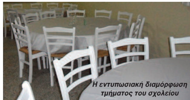
Η εντυπωσιακή διαμόρφωση τμήματος του σχολείου