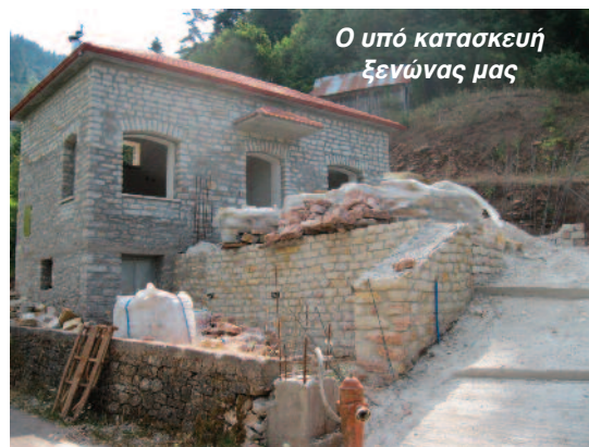
Ο υπό κατασκευή ξενώνας μας

έργο σαν μακρινό όνειρο. Η επιμονή όμως, η εργατικότητα, η ειλικρίνεια και η διαφάνεια του Συλλόγου κατόρθωσαν την υλοποίηση του στόχου. Ξεπεράστηκαν βασικά εμπόδια όπως η παροχή νερού και ρεύματος. Άκρως σημαντική βοήθεια στην πρώτη φάση