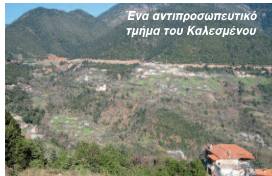
Ένα αντιπροσωπευτικό τμήμα του Καλεσμένου

Κε Μπακογιάννη, επειδή το έργο του προέδρου μας είναι σίγουρα πολύ μεγάλο και ψεγάδια μπορούν να βρουν μόνο οι κακοπροαίρετοι, σας ζητώ από τα βάθη της καρδιάς μου να σταθείται δίπλα του βοηθός και συνοδοιπόρος στο δύσκολο έργο που έχει αναλάβει. Το να προσπαθούν κάποιοι να μειώσουν τα επιτεύγματα του είναι ανώφελο, αφού αυτά μιλούν από μόνα τους. Είναι γεγονός φυσικά, ότι η δράση του έχει ενοχλήσει αρκετούς γιατί δεν είναι εύκολο να αλλάξει κάποιος το κατεστη-