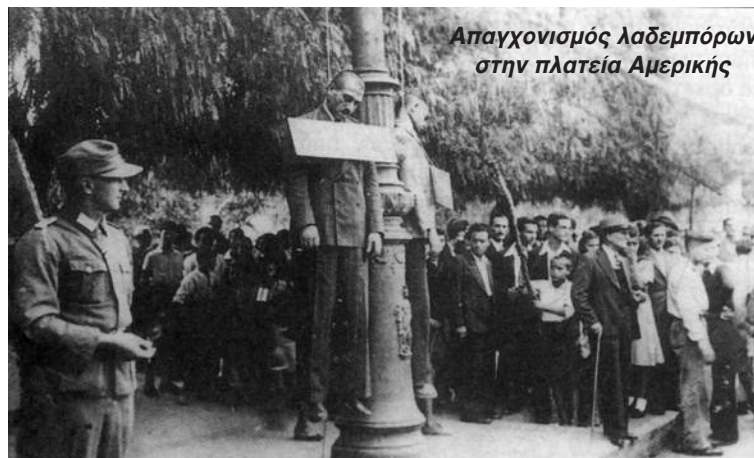
Απαγχονισμός Λαδερμπόρως στην πλατεία Αμερικής

μίας, ενίοτε και μεγάλους κληρικούς. Ορισμένοι εκμεταλλεύθηκαν τις θέσεις τους, οι οποίες τους παρείχαν την δυνατότητα πρόσβασης στις προμήθειες των αρχών κατοχής. Πολλές είναι οι μαρτυρίες που κάνουν λόγο για υπερβολικό πλουτισμό τοπικών αρχόντων σε διάφορες περιοχές της χώρας κατά το διάστημα της κατοχής. Οι περισσότεροι από αυτούς δεν δισταζαν να μετατρέψουν τα σπίτια τους σε χώρους συναλλαγής. Μία επίσης ομάδα που φάνηκε για ευνόητους λόγους να επωφελείται από την ανάληψη της διοίκησης της χώρας από τις δυνάμεις του Άξονα και πιο συγκεκριμένα τους Γερμανούς, ήταν