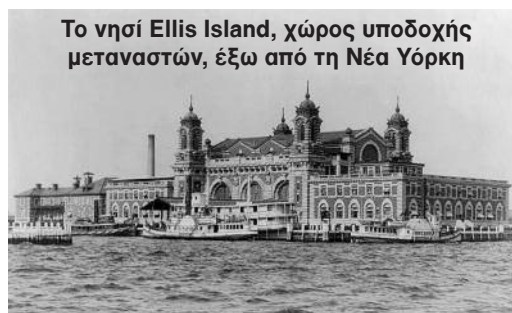
Το νησί Ellis Island, χώρος υποδοχής μεταναστών, έξω από τη Νέα Υόρκη