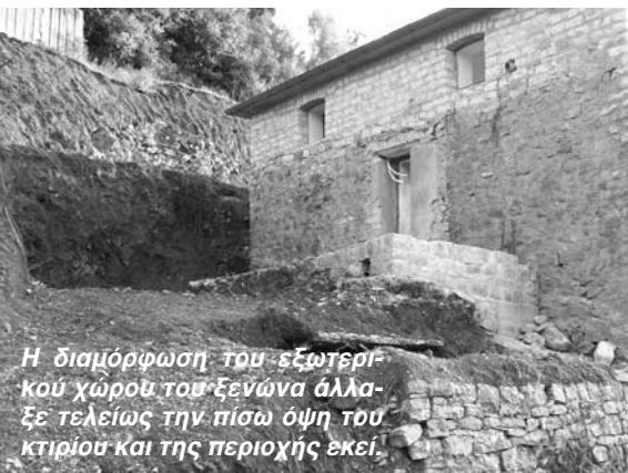
Η διαμόρφωση του εξωτερικού χώρου του ξενώνα άλλαξε τελειώς την πίσω όψη του κτιρίου και της περιοχής εκεί.