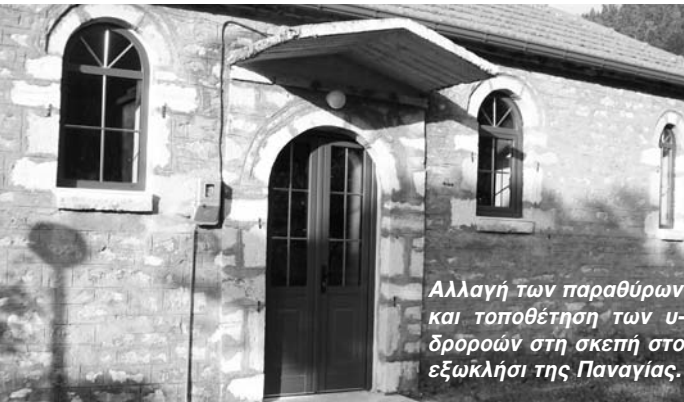
Αλλαγή των παραθύρων και τοποθέτηση των υδρορροών στη σκεπή στο εξωκλήσι της Παναγίας.