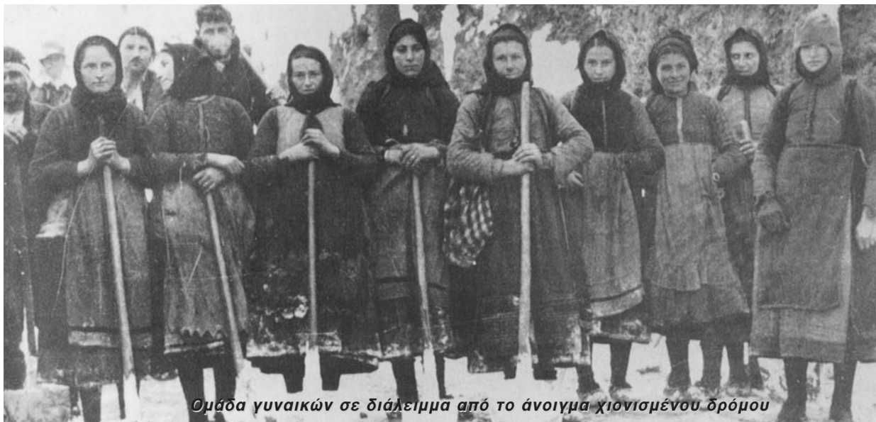
Ομάδα γυναικών σε διάλειμμα από το άνοιγμα χιονισμένου δρόμου

και έκανε να κραυγάζουν: «Μπροστά όλο μπροστά...!» Γι αυτό και η μορφή τους χαρακτήριζε αδρά στη μνήμη και τις μαρτυρίες των αγωνιστών του 40. Ο Αργύρης Μπαλατσός στο «Ημερολόγιο Πολέμου» μαρτυρεί: «Σήμερα σκοτώθηκαν 2 παιδιά του συντάγματος και αυτό μάνιασε περισσότερο τους στρατιώτες. Φώναζαν εμπρός για τη Ρώμη. Ο θάνατος αυτός αντί να μας δειλιάσει μας έδωσε περισσότερα φτερά για να κυνηγήσουμε τους Ιταλούς. Συνάντησα γυναίκες που κουβαλούσαν πυρομαχικά. Μία ήταν 88 ετών. Μια μου είπε ότι κλειδώσε το μικρό της σε μια καλύβα για να έρθει και να δοθηθεί στο στρατό. Το βράδυ είδα μια γριούλα να κρατά δύο μικρά και η μητέρα τους να ζυ-