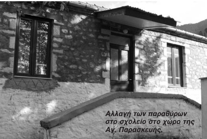
Αλλαγή των παραθύρων στο σχολείο στο χώρο της Αγ. Παρασκευής.