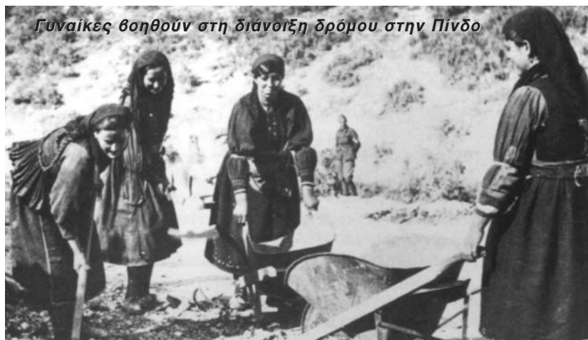
Γυναίκες βοηθούν στη διάνοιξη δρόμου στην Πίνδο

δυό λόγια να τους τονώσω. Με διέκοψαν οι λυγμοί ενός τραυματία από την Κρήτη. Τον πλησίασα. Είχε χειρουργηθεί τα ξημερώματα της ίδιας ημέρας. Κρατούσε στα χέρια του μια φωτογραφία της γυναίκας του και των δύο παιδιών του. -Αχ! Αδελφή, μου είπε. Δεν θα ξαναδώ την οικογένειά μου στην Κρήτη! Τα λόγια του τόσο μου σπάρξαν την καρδιά, που από πέτρα να ήταν θα λύγιζε. Τα δάκρυά μου θόλωσαν τα μάτια. Βγήκα έξω. Ησυχία. Βλέπω ένα αυτοκίνητο που φόρτωνε κουβέρτες, χάρτινα κιβώτια γεμάτα φαρμακευτικό υλικό και τροφές. Κανείς δεν ήταν κοντά στο φορητό. Πήρα ένα κιβώτιο και μια κουβέρτα και ανέβηκα επάνω.