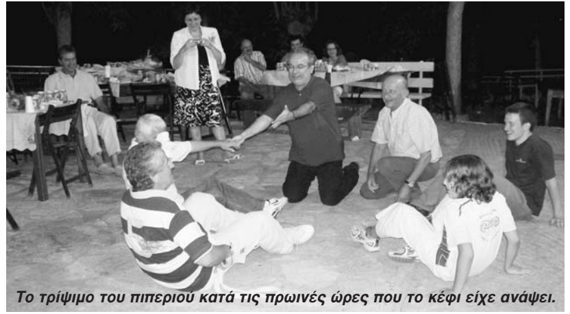
Το τρίψιμο του πιπεριού κατά τις πρωινές ώρες που το κέφι είχε ανάψει.

Στη συνέχεια πήρε το λόγο ο αρχηγός της ελάσσονος αντιπολίτευσης κ. Ντίνος Μπομποτσιάρης που χαρακτηριστικά είπε ότι πρέπει να στηρίζουμε την πολιτιστική παράδοση του τόπου. Συνεχάρη επίσης το Δ.Σ. και τον Πρόεδρο του Συλλόγου