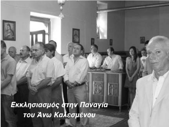
Εκκλησιασμός στην Παναγία του Άνω Καλεσμένου

Στο Παπαρούσι γίνεται λειτουργία στο εξωκλήσι της Παναγίας στις 23 Αυγούστου. Τότε παρουσιάζεται μια ευκαιρία για συνεύρεση χωριανών και φίλων και θα πρέπει να αξιοποιηθεί περισσότερο.