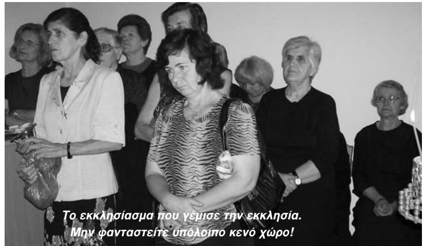
Το εκκλησιασμά που γέμισε την εκκλησία. Μην φανταστείτε υπόλοιπο κενό χώρο!

ταν και έλαμψε σαν ήλιος. Σαν ήλιος είπε ο ευαγγελιστής για να μη νομισουμε αισθητό αυτό το φως. Γιατί αυτό το φως είναι της Θεότητας και είναι άκτιστο. Ο Χριστός μεταμορφώθηκε, όχι προσλαμβάνοντας ό,τι δεν ήταν, αλλά φανερώνοντας στους μαθητές του ό,τι ήταν, αφού τους άνοιξε τα μάτια και από τυφλούς τους κατέστησε βλέποντας. Επομένως αυτό το φως δεν είναι αισθητό, αλλά με τη δύναμη του αγίου Πνεύματος μετασκευάσθηκαν τα μάτια τους, μεταμορφώθηκαν εκείνοι.