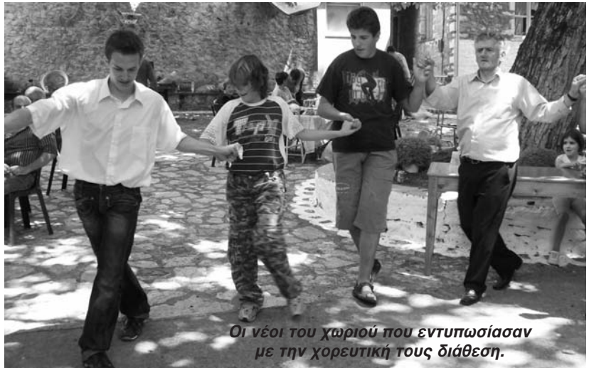
Οι νέοι του χωριού που εντυπωσιάσαν με την χορευτική τους διάθεση.

Όταν βοηθάς και συμμετέχεις στο Σύλλογο προσφέρεις και τιμάς τον τόπο σου και το χωριό σου.