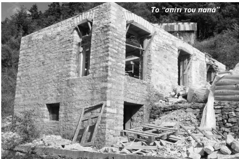
Το "σπίτι του παπά"

Ετοιμάζονται να εκδοθούν τα νέα ημερολόγια του 2009. Παρακαλούμε για το ενδιαφέρον όλων των χωριανών και φίλων μας. Κάθε ευρώ που προσφέρεται στο σύλλογο πιάνει τόπο και έχει απόδοση σε όλους μας. Θα σας πληροφορήσουμε στο επόμενο φύλλο μας για όσους δεχθούν πακέτο ημερολογίων που θα μοιράσουν στη συνέχεια σε άλλους.