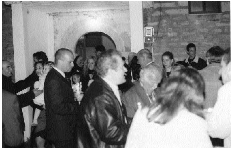
Ανάσταση 2006 στον Αη-Θανάση

Ωραία που ήταν η Ανάσταση στο χωριό μας! Πόση συγκίνηση! Ευχαριστούμε το Θεό που μας αξίωσε να συμβρεθούμε με τους συγχωριανούς στον Αη-Θανάση και να γιορτάσουμε την Ανάσταση του Κυρίου μας για πρώτη φορά!