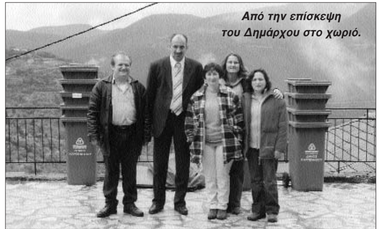
Από την επίσκεψη του Δημάρχου στο χωριό.

Χαιρόμαστε ιδιαίτερα, ευχαριστούμε όλους όσους κόπιασαν